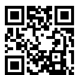
Ersatzhaltestelle Richtung Hademarschen

Verlassen Sie den Bahnsteig und begeben Sie sich an die Dorfstraße. Biegen Sie nach links ab und folgen Sie dem Straßenverlauf ca. 500 m bis zur Bundesstraße. Biegen Sie nach rechts bzw. nach links ab und begeben Sie sich an die jeweilige Ersatzhaltestelle.